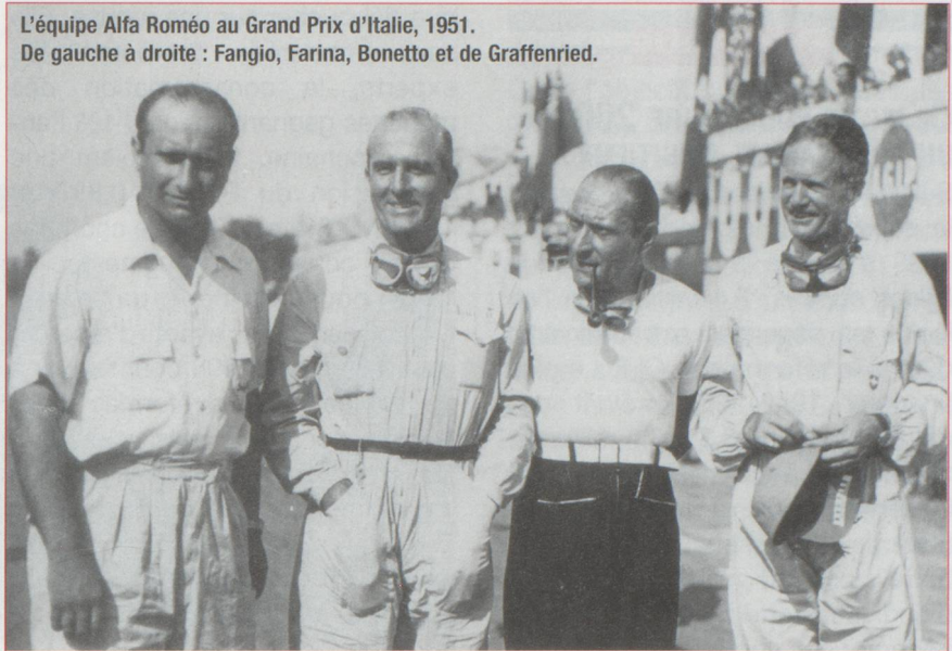
L'équipe Alfa Roméo au Grand Prix d'Italie, 1951. De gauche à droite : Fangio, Farina, Bonetto et de Graffenried.

courci ses châssis. La saison ne sera hélas pas aussi brillante qu'escomptée. Les deux nouvelles "Maserati Platé" sont engagées au Grand Prix de Syracuse le 16 mars aux mains de Louis Chiron et Toulo de Graffenried. Pendant les essais, la voiture du monégasque prend feu. Chiron est gravement brûlé. Toulo prend le départ mais devra aban-