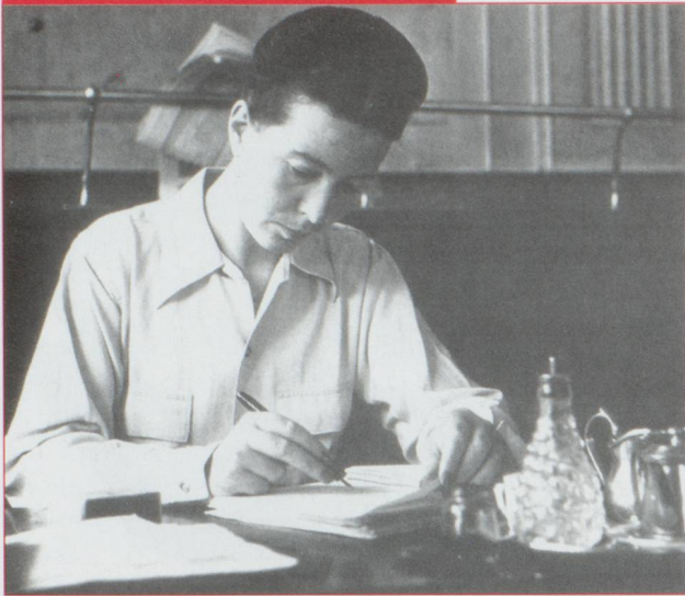
Simone de Beauvoir au Café des Deux Magots, en 1945.