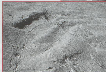
Dans les Gorges de Moutier, l'escalade se pratique sur les pas des dinosaures.

semble pour le moins étonnant de trouver des traces de ces monstres sur des parois escarpées de Moutier. L'explication est simple : à l'époque, la région était plate et bordait la Mer de Thétys. Les dinosaures marchaient au bord de l'eau sur un sol calcaire et vaseux qui s'est brusquement relevé sous l'effet des plissements sismiques lors de la formation de la chaîne jurassienne. Le calcaire s'est solidifié, les empreintes sont restées. Pour l'instant, seuls les alpinistes confirmés peuvent approcher les traces. Pour les touristes moins agiles à la varappe, un télescope public a été installé en face de la paroi du Raimeux et un vaste projet est à l'étude : il prévoit pour les prochaines années un sentier didactique balisé de panneaux explicatifs qui permettra au