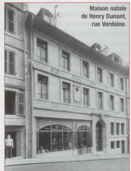
Maison natale de Henry Dunant, rue Verdaine.