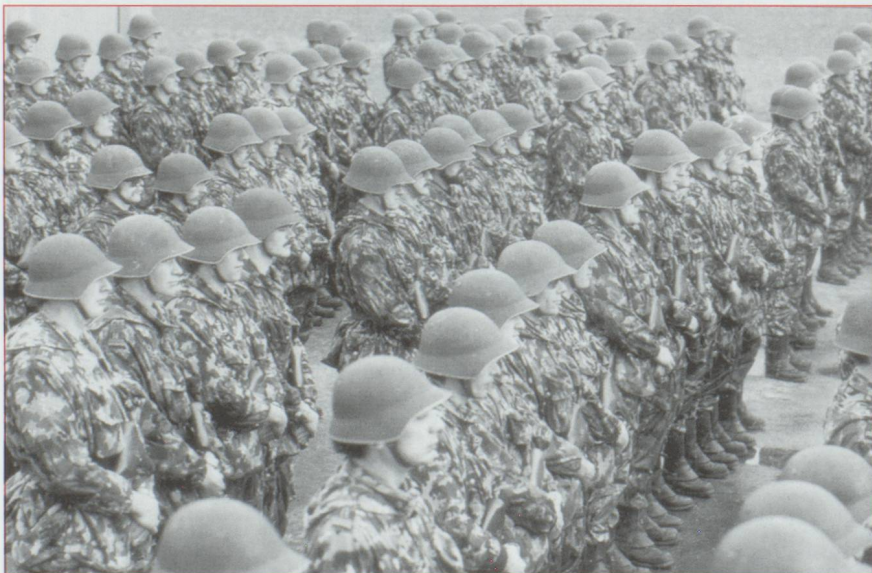
L'armée suisse sera ramenée de 400 000 à 358 000 hommes.

Une étude publiée dernièrement par la Banque Pictet & Cie passe le système fiscal suisse au peigne fin et revient sur quelques idées reçues. La part des différents impôts dans le budget de la Confédération est comparée à celle des grands pays de l'OCDE (les États-Unis, la France, l'Allemagne et le Royaume-Uni). Premier constat : 44,3% des recettes fiscales proviennent en Suisse de l'impôt sur le revenu, sur la fortune et sur les gains en capitaux mobiliers et immobiliers, ce qui