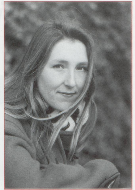
Marie Darrieussecq sur les traces de Lewis Carroll