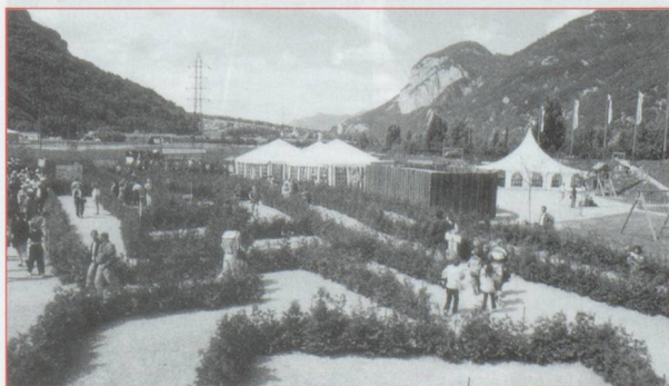
Labyrinthe Aventure - CH-1902 Evionnaz Tél : 00 41 27 767 14

Berne - Quelque 3400 jodleurs, lanceurs de drapeaux et joueurs de cor des Alpes se sont affrontés devant 20 000 personnes à Anet lors de la fête cantonale bernoise du jodel. Durant trois jours, les jodleurs ont donné de la voix pour se qualifier pour la fête fédérale de 1999 à Frauenfeld.