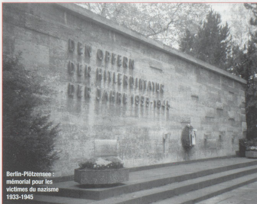
Berlin-Plötzensee : mémorial pour les victimes du nazisme 1933-1945