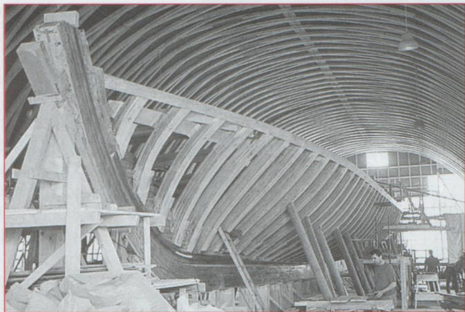
La galère de Morges, un chantier unique au monde.