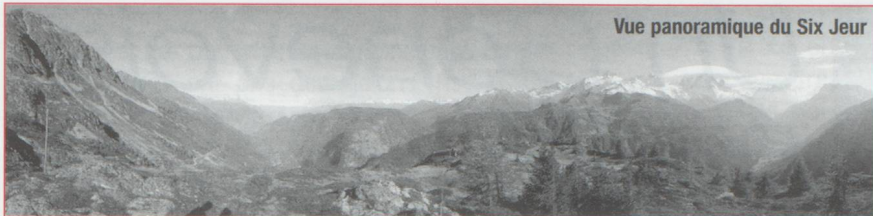
Vue panoramique du Six Jeur