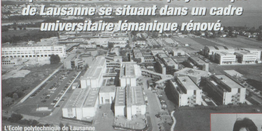
L'École polytechnique de Lausanne