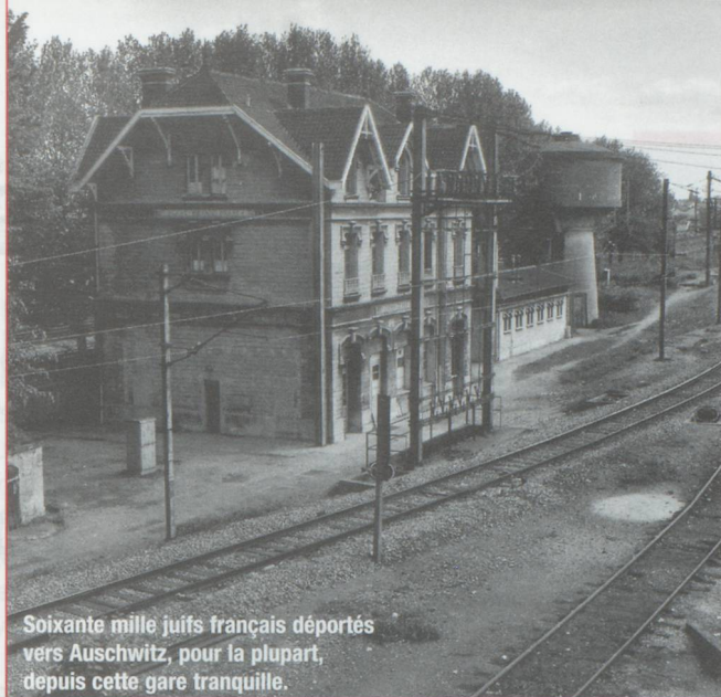
Soixante mille juifs français déportés vers Auschwitz, pour la plupart, depuis cette gare tranquille.