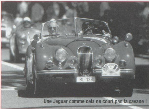
Une Jaguar comme cela ne court pas la savane !

La capitale fédérale accueille le week-end des 23 et 24 juin le Grand Prix Bern Revival 2001. L'occasion pour tous les spectateurs d'admirer de superbes voitures de courses et motos historiques. Organisé en 1998, le premier Revival avait attiré près de 50 000 curieux et passionnés. Cette année, un plateau spécial composé de Jaguar constituera la