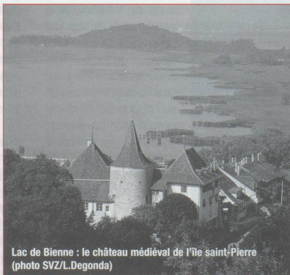
Lac de Bière : le château médiéval de l'île saint-Pierre

Au sud, en forme d'« i » majuscule allant du bas vers le haut, Auvernier, resté village viticole, est devenu aujourd'hui un lieu de résidence privilégié. Il vaut la peine de s'arrêter sur les hauts de la commune pour admirer les toits de ses demeures avant de descendre la grand-rue, bordée de belles maisons du XVI e siècle pour se rendre à la cave, goûter le fameux chasselas gouleyant. Colombier, avec son terrain de Plaineyse, est devenu un des centres de l'aviation légère en Suisse, Vaux-Marcus, situé légèrement sur la hauteur, se targue d'avoir un superbe château. Au nord, Saint-Blaise, avec