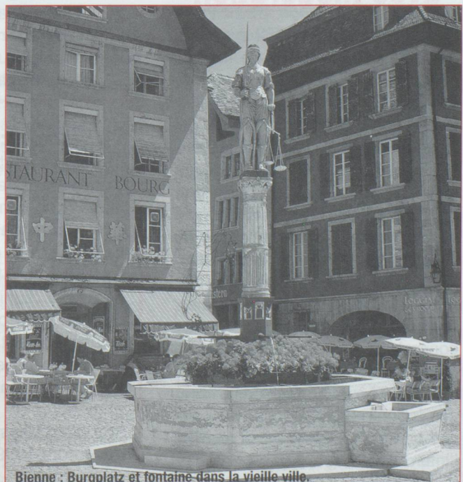
Bienne : Burgplatz et fontaine dans la vieille ville.