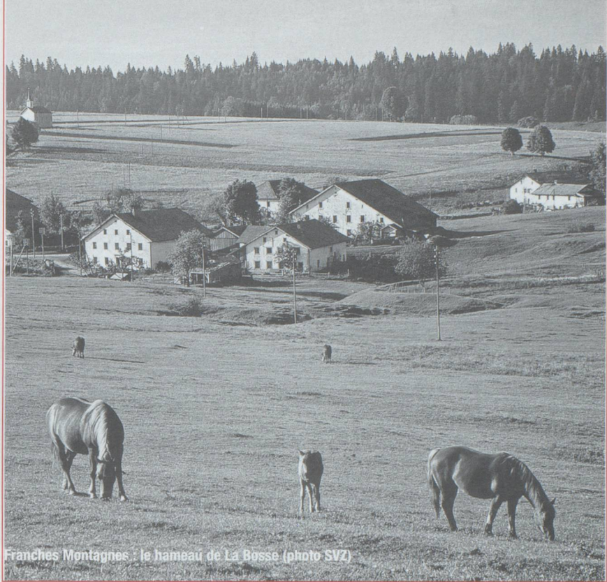
Franches Montagnes : le hameau de La Bosse

Il fut un temps pas si lointain où faire le voyage de Neuchâtel à la Chaux-de-Fonds en hiver n'était pas une sinécure. Le passage du col de la Vue des Alpes, souvent enneigé, ressemble parfois à une expédition laborieuse. Pourtant, arrivé au haut