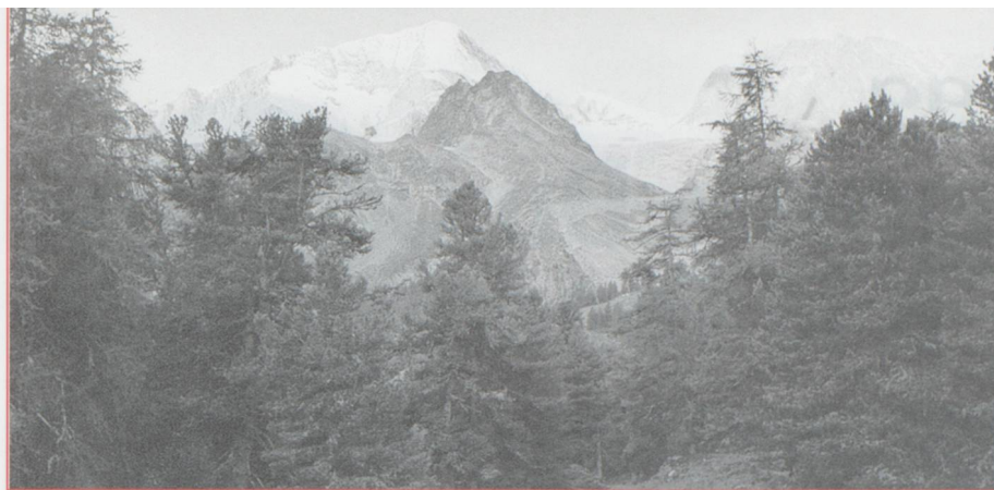
La Pigne d'Arolla

J'aime ces routes de montagne, où l'on se dirige vers un ailleurs qui semble toujours inaccessible, le but paraissant s'éloigner au fur et à mesure de la montée. Si seulement les Valaisans n'étaient pas si pressés ! Je ne me suis jamais fait autant klaxonner que pendant ce voyage. Le mythe du Suisse (les Français, vous le savez, ne font pas de différence entre les habitants des différents cantons) qui prend son temps n'a pas résisté à ces quelques jours de vacances. Mais nous arrivons à l'hôtel Kurhaus, à près de 2000 mètres d'altitude. Une vieille