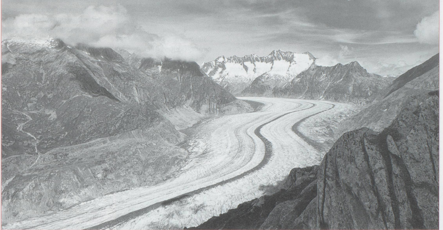
Le glacier d'Aletsch