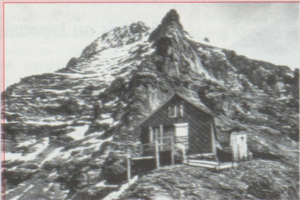
Cabane Guggi à 2791 mètres

des voies d'accès et de partir très tôt au moment où la montagne est la moins dangereuse. Avant cela les alpinistes du début du XIX e étaient contraints d'utiliser des anfractuosités, des grottes, des surplombs ou de construire des abris de fortune. En 1872 apparut le premier refuge, la cabane Rottal dans la proche vallée de Lauterbrunnen. La fondation du Club alpin suisse en 1863, a permis d'accélérer la construction et l'entretien de ces cabanes qui se sont multipliées dans l'arc alpin.