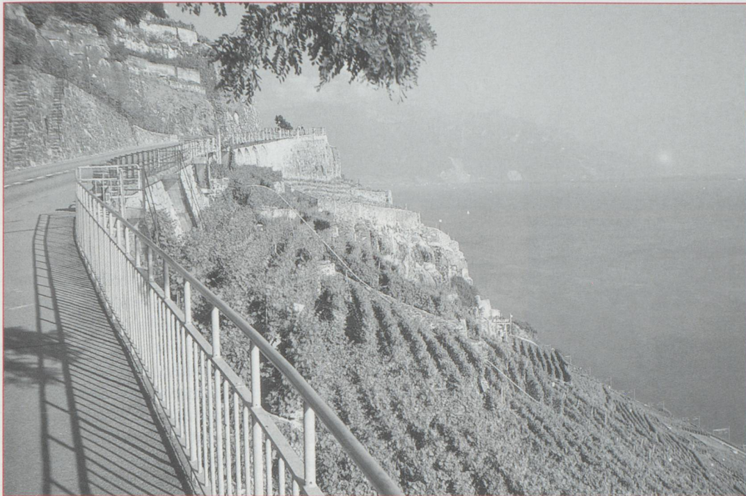
Les vignes et le Léman, vus de la Corniche.