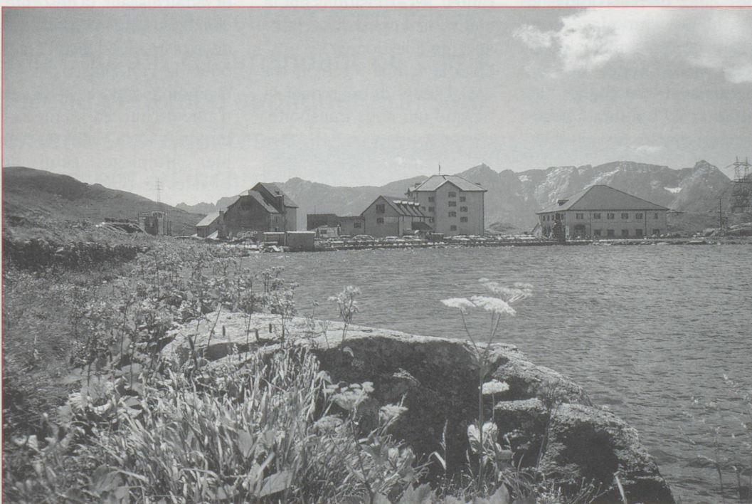
Le lac du Col du Saint Gothard.

qu'aux îles de Brissago. L'une d'elles, l'isola Grande, se visite avec bonheur. Cette ancienne propriété privée, acquise par la Confédération dans les années quarante est un véritable jardin d'Éden, avec sa végétation luxuriante, ses espèces botaniques multiples, sa villa ancienne qui la surplombe. Un petit paradis posé au milieu des flots bleus du lac... On quitte à regret le lac Majeur, pour plonger avec délice dans les Centovalli. La route surplombe cette vallée encaissée, très boisée. Le car et sa remorque peinent sur les routes sinueuses, mais quelle splendeur ! Juste après la frontière, la route traverse la petite localité italienne de Re, qui attire de nombreux pèlerins depuis que la Vierge Marie y serait apparue. Après Domodossola, on s'appête à regagner la Suisse et gravir le col du Simplon. Nous traversons Gondo, village sinistré