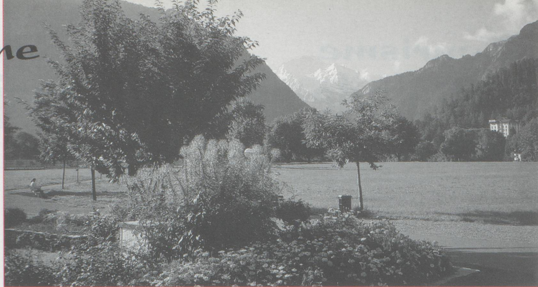
Interlaken : vue sur la Jungfrau.

Bienvenue au Japon ! Que tous ceux qui s'inquiètent de la renommée touristique de la Suisse se rassurent : les touristes sont bien là. Grindelwald serait-elle devenue japonaise, tant les touristes nippons y sont nombreux et disposent même d'un office de tourisme qui leur est réservé ? Après une bonne nuit de repos et une consultation