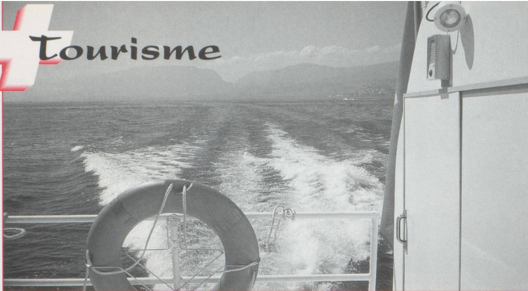
À bord de la navette Iris, sur le lac de Neuchâtel.

▷ il y a quelques mois, puis la route emprunte un passage fort encaissé et sauvage. L'on commence à apercevoir les hautes montagnes valaisannes, notamment le Fletschhorn (3996 m). La route, large et confortable, amène sans difficulté jusqu'au col du Simplon. La vue y est splendide. D'un côté, les montagnes valaisannes, de l'autre, les montagnes bernoises au loin et leur sommet, le Finsteraarhorn (4274 m). Il faut déjà repartir car la route est longue, qui doit nous amener jusqu'à Orbe, dans le canton de Vaud. En attendant, direction la vallée du Rhône, Brigue et son célèbre château de Stockalper, du nom du célèbre brasseur d'affaires et mécène haut-valaisan Kaspar Jodok von Stockalper. En descendant la vallée, on parvient à Pfywald, la plus grande pinède de Suisse, malgré un incendie qui l'a en partie ravagée, il y a quelques années. Voici maintenant Sion, capitale du Valais, avec sa forteresse épiscopale et son église Notre-Dame-de-Valère (du XI e au XV e siècle) qui semblent veiller sur la vallée. Chaque commune mériterait un arrêt : Martigny et sa Fondation Gianadda, Saint-Maurice et son abbatale, et surtout son trésor, l'un des plus importants de la chrétienté... Nous arrivons jusqu'au Léman, et avons la