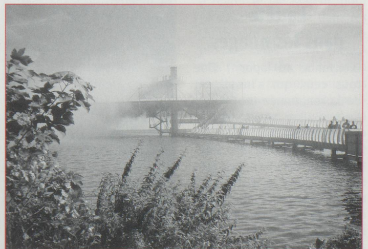
Arteplage d'Yverdon-les-Bains : le nuage artificiel.

Avec un tel apéritif, le repas est vite avalé et nous reprenons la direction de Bulle puis de Gruyères et son imposant château qui semble veiller avec tranquillité sur la délicieuse petite cité. La vallée de la Sarine se fait soudain plus étroite en direction de Château-d'Oex. La route semble enlacer la voie de chemin de fer du