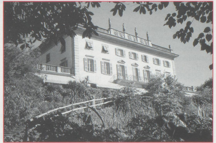
Brissago : la villa de l'isola Grande.

Après une bonne nuit de repos, nous abordons les rives enchantées du lac Majeur. De Porto Ronco, un bateau nous emmène jus-