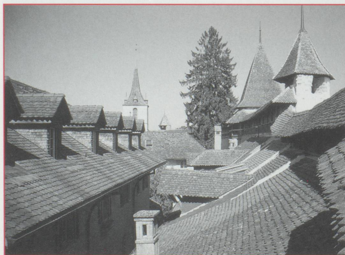
Les toits de la vieille ville de Morat, vus des remparts.

Le lendemain matin est consacré à la découverte de l'arteplage d'Yverdon. La ville est réputée pour ses bains, elle le sera peut-être aussi pour son nuage artificiel, principale attraction de l'arteplage. Pour y parvenir, il faut se déguiser en "Schtroumpf" et endosser une pèlerine en plastique bleu, du plus bel effet... Autre moment sympathique et rafraîchissant, la descente, chaleureusement applaudie, de la piste de ski installée au bout de l'arteplage, par les champions suisses d'hier et d'aujourd'hui. La journée se termine par la visite du dernier arteplage, celui de Bienne, le plus étendu de tous, avant de rejoindre Genève, où finit malheureusement le voyage. Après tant de merveilles vues ou entraperçues, on n'a qu'une seule envie : revenir au plus vite, car les lieux qui méritent à eux seuls le voyage sont légion. Ce sera peut-être bientôt, à l'occasion d'un autre voyage organisé par Suisse Magazine ?