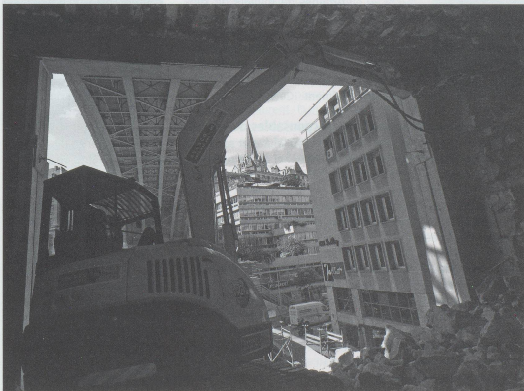
Au travers des piles du pont Bessières.

De très nombreux autres ouvrages de génie civil sont en cours, pour dévier des rivières enterrées, pour restructurer les réseaux d'eau potable et d'électricité, pour