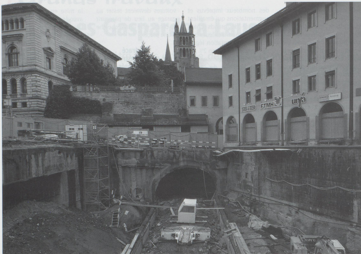
Le début de l'attaque du tunnel Viret.

▷ consolider des voies, pour préserver l'environnement. Il ne faut pas oublier qu'en outre, Lausanne en profite pour déplacer sa station de traitement des ordures ménagères et créer une ligne de chemin de fer souterrain, de Sébeillon à la nouvelle Tridel, afin de con-