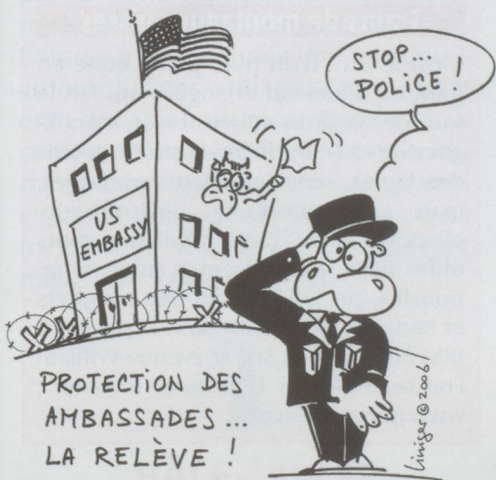
PROTECTION DES AMBASSADES... LA RELEVÉ!

● L'armée n'est pas faite pour protéger des ambassades. Le Conseil national a accepté à l'unanimité une motion de sa commission de la politique de sécurité proposant de retirer, au moins partiellement, cette tâche aux soldats. Il incombe à la police civile de prendre la relève.