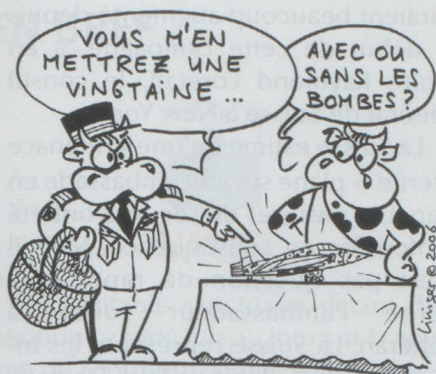
L'ARMÉE FAIT SES ACHATS DE NOËL...

● L'armée préconise l'achat d'une vingtaine d'avions pour remplacer ses 54 Tiger qui en 2010 auront atteint les trente ans de service. Sans ces nouveaux avions, avec seulement 33 appareils, elle s'estime incapable de garantir la sûreté globale de l'espace aérien suisse, d'assurer la police aérienne ou de faire face à une attaque terroriste par exemple. Le coût de cette vingtaine d'avions est estimé à environ 3 milliards de francs. Le Groupe pour une Suisse sans armée (GSSA) pourrait une nouvelle fois recourir à l'initiative populaire pour s'opposer à ce nouveau programme d'armement.