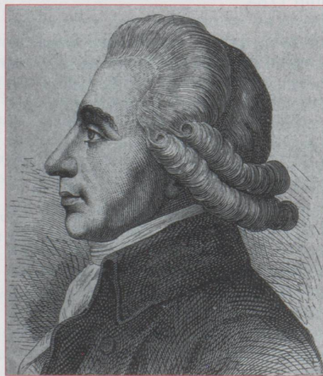
Emmanuel Joseph Sieyès

L'historien Jacques-Olivier Boudon nous rappelle que Napoléon connaissait le livre publié en 1797 par l'historien suisse, Jean de Muller, Vue générale de l'Histoire du genre humain , « qui a alors rencontré un grand succès. Or Napoléon eut l'occasion de s'entretenir avec Muller, devenu ministre du royaume de Westphalie et sans doute lui a-t-il emprunté ses vues sur le devenir des États-Unis et de la Russie, puissances montantes face à une Europe sur le déclin » 9 . En août 1807, dans un discours au Corps législatif à la suite de sa victoire sur les Russes, l'empereur évoque le « système fédératif » qui unit la France aux peuples de l'Europe, « l'agglomération » des peuples étant dans son esprit un préalable à l'unité de l'Europe, tout comme d'ailleurs l'agglomération des cantons avait été à la base de la création de la Confédération suisse. Or l'expression « système fédératif » est précisément empruntée au système adopté pour la Suisse lors de la Consulta de 1802-1803. Il reviendra sur ce thème en 1815 quand, dans le préambule de l'acte additionnel aux constitutions de l'Empire, Napoléon explique : « Nous avons alors pour but d'organiser un grand système fédératif européen, que nous avons adopté comme conforme à l'esprit du siècle ». Or, à en croire