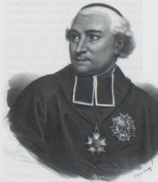
Le cardinal Fesch

même, dit-on, une assez grande quantité de tableaux, statues et choses précieuses qui, depuis, ont servi à décorer ses différentes résidences. Plus tard, devenu archevêque de Lyon et cardinal, il eut le bon esprit de se pénétrer des devoirs de ces deux dignités, et il finit par acquérir dans le clergé une réputation assez honorable » 5 . Le Musée Napoléonien de l'Hôtel de Ville d'Ajaccio conserve plusieurs représentations du cardinal Fesch. Après la chute définitive de son neveu, il s'installe à Rome. À son décès le 13 mai 1839, le cardinal Fesch laissa une formidable collection de 16 000 tableaux, dont près d'un millier constituent le noyau de la collection du Musée Fesch. Sa dépouille ainsi que celle de Madame Mère reposent depuis 1860 dans la chapelle impériale à Ajaccio. ▷