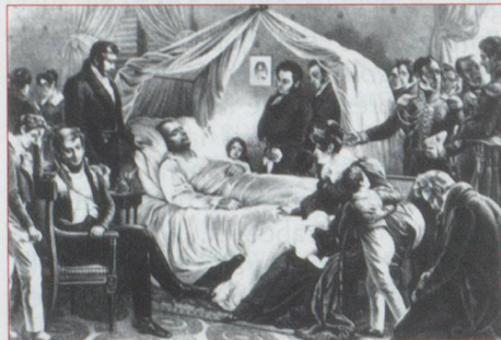
Napoléon sur son lit de mort

Le monde de la banque suit naturellement avec la plus grande attention l'évolution des événements. Malheur