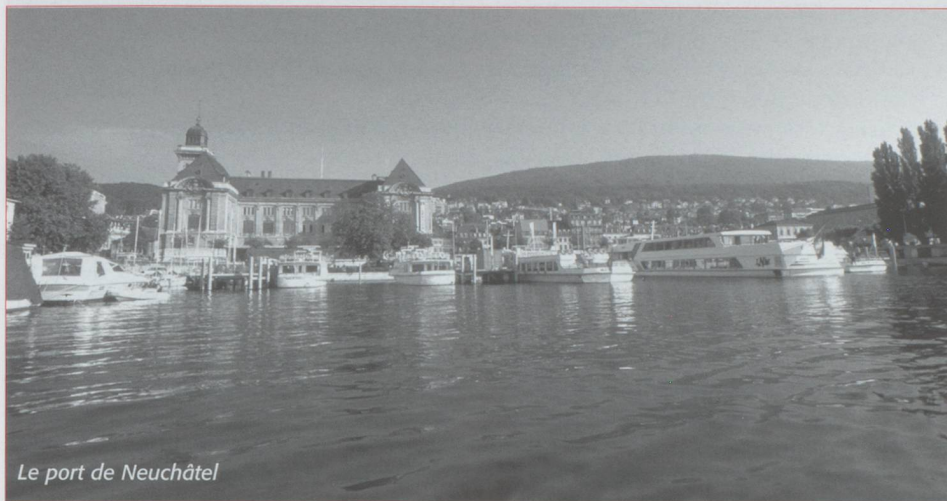
Le port de Neuchâtel