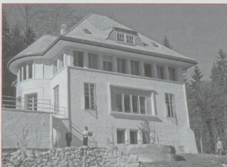
La villa Blanche

De grands citoyens y sont nés, Chevrolet et ses belles américaines, Frédéric Sauser, alias Blaise Cendrars qui nous prouve que tous les chemins partent de la Chaux-de-Fonds et le Corbusier dont on parle plus loin qui s'est fait un nom en France.