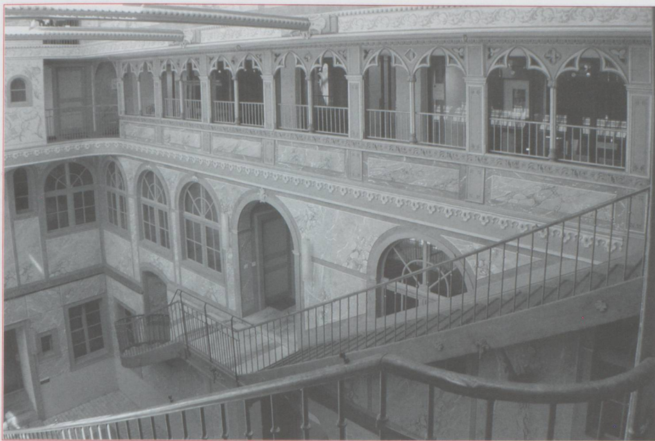
La Chaux-de-Fonds, ancien manège

Les résultats furent inespérés et méritèrent bien vite qu'ils soient mis en valeur.