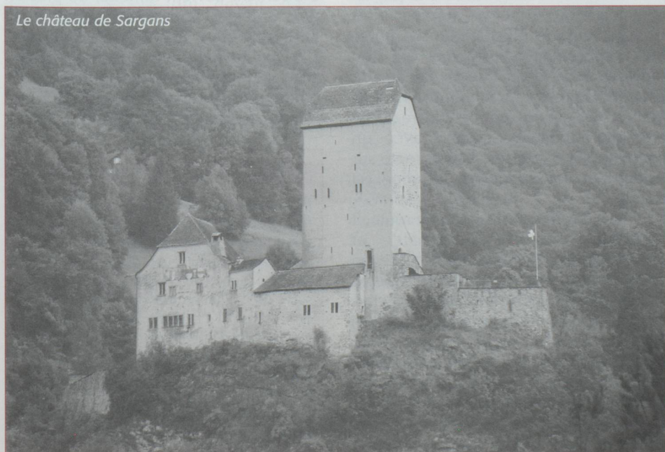
Le château de Sargans

Voici la troisième alternative. Il faut alors traverser Davos, cette ville à la montagne, la plus élevée d'Europe, toute en longueur, près de quatre kilomètres, sans charmes apparents si ce n'est la réputation des ses pistes de ski, son Forum économique qui réunit les plus grandes sommités mondiales ou son équipe de hockey sur glace maintes fois championne de Suisse. Descendant la vallée de la Landwasser en direction de Tiefencastel, arrivés à Alvaneu, on fera presque un virage à 180° pour prendre la route de l'Albula, un de nos coups de cœur. En contrebas, dans un site idyllique, avis aux amateurs, un golf de 18 trous. La route, facile au début, nous réserve quelques surprises. D'un coup, face à nous, le viaduc en courbe de la Landwasser dont les photos font le tour du monde. Peu après, la route se rétrécit. Non sans raison, poids et largeur des véhicules sont limités. Le paysage devient sauvage, la route s'accroche à la montagne avant de retrouver quelques doucereux forestières. Et là, ô surprise, nous retrouvons grandeur nature une maquette exposée en son temps à l'Office national suisse du tourisme à Paris permettant de découvrir un chef-d'œuvre ferroviaire, admi-