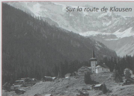
Sur la route de Klausen

qui n'est pas de trop avant d'entamer une descente aux promesses encore insoupçonnées. Non seulement la chaussée est étroite mais il faut bien s'y accrocher, car creusée dans le rocher qui tombe à pic, elle offre un vide impressionnant d'un côté. Heureusement à cet endroit c'est à peu près plat. En nous imitant, vous serez du côté montagne. Les oreilles aux aguets, vous entendrez suffisamment tôt les trois notes les plus célèbres de toute l'Helvétie : do dièse, la, mi en la majeur tirées de l'andante de l'ouverture de Guillaume Tell de Rossini, le célèbre klaxon des cars postaux, afin d'avoir le temps de vous arrêter. Quelques bonnes centaines de mètres plus loin, on retrouve une route moins agressive pour les battements du cœur bien qu'elle se mette à descendre assez vigoureusement. La plaine est là ou presque : Bürglen, la patrie de notre héros mythique avec sa statue et un petit musée bien intéressant, Altdorf, le chef-lieu et le monument géant érigé à sa gloire.