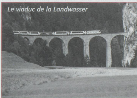
Le viaduc de la Landwasser

Enfin c'est la longue vallée de Conche, arrosée par le Rhône encore bien modeste mais qui témoigne déjà d'une force et d'une majesté futures, jusqu'à Brigue, la cité des Stockhalper et de son