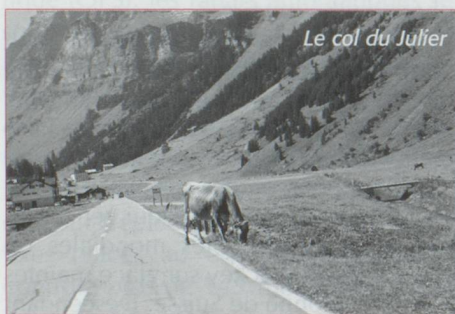
Le col du Julier

Pour aller de Saint-Moritz en Suisse centrale, nous avons deux itinéraires à choix qui commencent de façon similaire par le col du Julier. Partant de la célèbre station, c'est l'occasion de découvrir les quatre lacs : St Moritz,