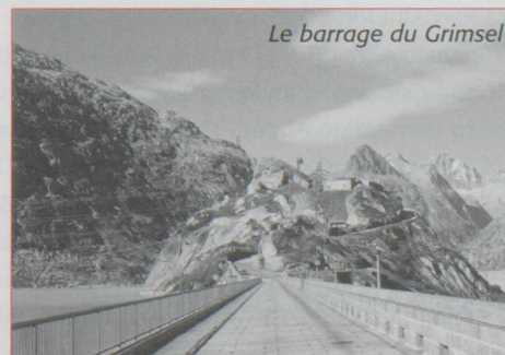
Le barrage du Grimsel

La vallée du Hasli est une des plus grandes vallées transversales du massif alpin. Elle s'étend du col du Grimsel au lac de Brienz. Le fond plat de la vallée inférieure est séparé de la partie supérieure par un imposant rempart de rochers entre Meiringen et Innertkirchen. L'Aar a, au cours des millénaires, creusé un passage à travers ces roches et formé des gorges de 1 400 mètres de