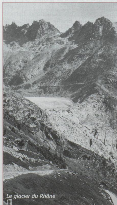
Le glacier du Rhône

D'autre part, certaines sont interdites aux voitures tractant des remorques ou caravanes, aux cars et camions de plus de 2,30 mètre de largeur et d'un poids supérieur à 12 tonnes.