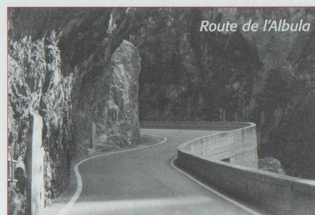
Route de l'Albula

Bifurquons résolument vers la gauche pour emprunter la vallée fertile du Prättigau vêtue d'une farandole de verts, vouée à l'agriculture, à l'élevage et au tourisme en devenant le paradis de la trottinette. La route est agréable jusqu'à Klosters, jolie station chère au prince Charles d'Angleterre. Les choses sérieuses vont commencer. Pour nous rendre à Saint-Moritz, nous avons deux options, même trois si l'on sait que l'on peut charger sa voiture sur le train grâce au tunnel récent de la Vereina. Comme nous sommes en été, nous allons profiter de l'air libre et emprunter le col de la Fluëla qui va de Davos à Susch en Basse-Engadine. Dans un environnement hostile, la route serpente en grim pant jusqu'à 2 383 mètres d'altitude. Ici comme ailleurs, petit à petit, en montant la végétation se modifie, les derniers mélèzes ou aroles se raréfient avant de disparaître, quelques névés ont résisté au soleil. Le Weisshorn et le Schwarzhorn, le blanc et le noir dominent la situation et les éboulis qu'ils ont engendrés au cours des siècles sont impressionnants. Un arrêt au sommet est bienfaisant après une telle somme de