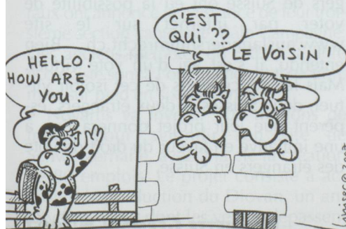
L'ANGLAIS POSSIBLE EN PREMIÈRE LANGUE

● Le second volet des nouvelles lois sur l'asile et les étrangers, adoptées par le peuple suisse en septembre 2006 et en vigueur en ce début d'année. Mais un nouveau tour de vis s'annonce. Christoph Blocher ne veut plus en effet que des déserteurs ou des objecteurs de conscience obtiennent d'office le statut de réfugiés, comme c'est actuellement le cas suite à une décision de principe de la Commission de recours en matière d'asile concernant les Erythréens. Le ministre avait déjà critiqué cette décision début 2007. Évoquant le problème de l'afflux de demandes d'Erythrée, il a chargé son département d'élaborer un projet d'arrêté fédéral urgent modifiant la loi sur l'asile. Une telle procédure permettrait d'appliquer cette disposition dès son adoption par le Parlement.