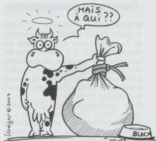
"ALERTE ENLÈVEMENT" PEUT DONNER DE MAUVAISES IDÉES

● Le Conseil national n'est pas opposé à une loi sur l'internement à vie pour les délinquants jugés dangereux. Il a décidé par 103 voix contre 79 d'entrer en matière sur le projet du Conseil fédéral, déjà approuvé par le Conseil des États. L'objet est renvoyé en commission.