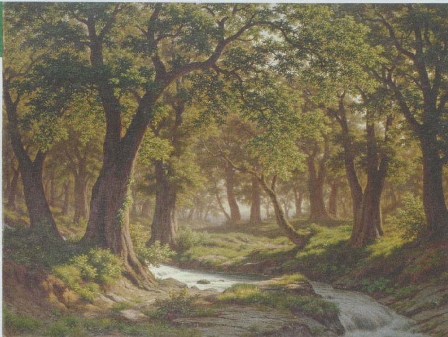
Exposition Schweiz ohne Schweiz, Schaffhouse Robert Zünd, Eichwald mit Bach, o. J. Öl auf Leinwand, 77.5 x 103.5 cm, Stiftung für Kunst, Kultur und Geschichte