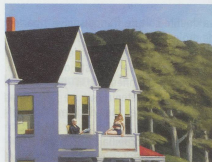
Edward Hopper (1882-1967) Second Story Sunlight (Soleil au balcon), 1960 Huile sur toile, 101,9 x 127,5 cm New York, Whitney Museum of American Art Achat financé par l'association Friends of the Whitney Museum of American Art, 60.54

Musée olympique, Quai d'Ouchy 1, CH-1001 Lausanne. Jusqu'au 13 mars 2011, tous les jours de 9 h à 18 h.