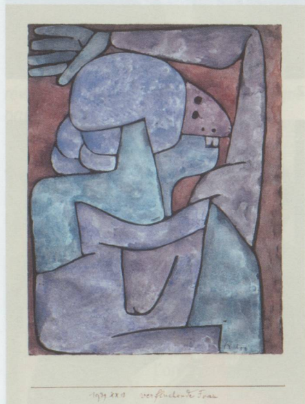
Paul Klee. Verfluchende Frau , 1939, 913 Aquarell, Tempera und Bleistift auf Grundierung auf Papier auf Karton. 32 x 24/23,6 cm. Privatbesitz Schweiz, Depositum im Zentrum Paul Klee, Bern

Musée historique de Berne, Helvetiaplatz 5, CH-3306 Berne. Du 7 octobre 2010 au 13 février 2011, du mardi au vendredi de 10 h à 20 h, samedi et dimanche de 10 h à 17 h.