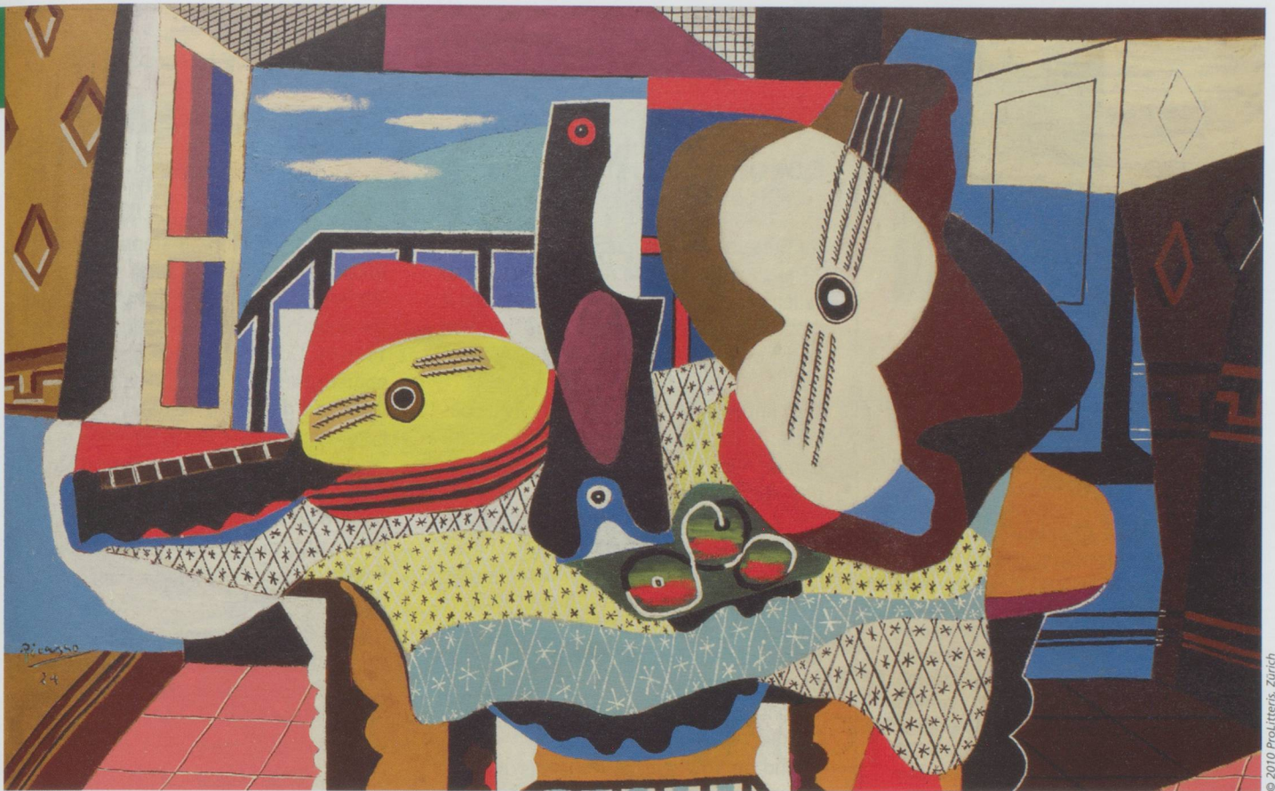
Pablo Picasso : Mandoline und Gitarre (Mandoline et guitare), 1924 Öl mit Sand auf Leinwand, 140,7 x 200,3 cm. Solomon R. Guggenheim Museum, New York