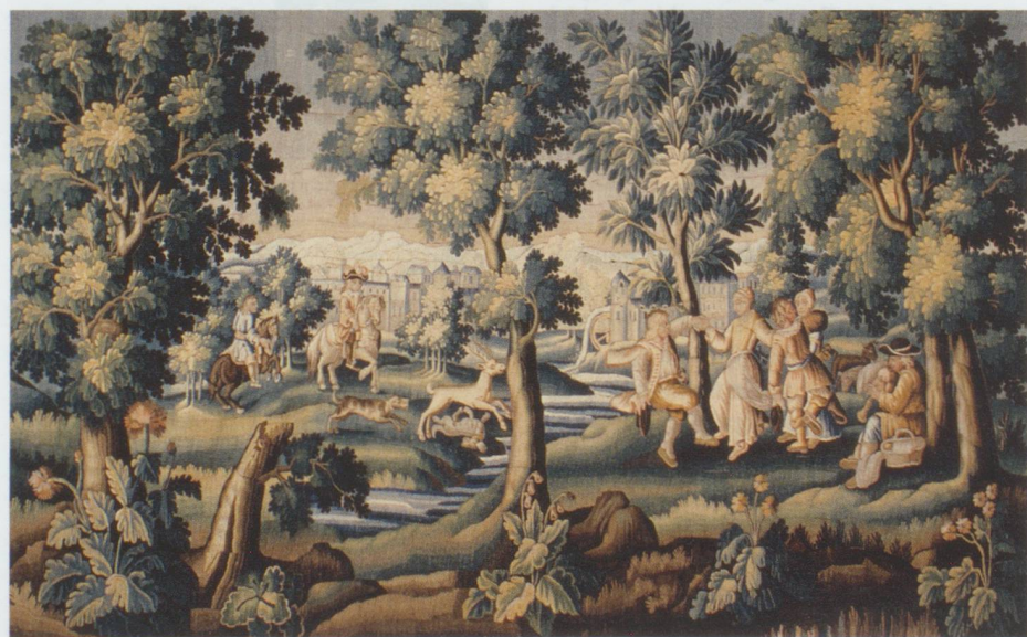
Ateliers d'Aubusson - Chasse au cerf, fin du XVII e s. (détail) Musée d'art et d'histoire Fribourg

Musée d'art et d'histoire, rue de Morat 12, CH-1700 Fribourg. Jusqu'au 27 février 2011, du mardi au dimanche de 11 h à 18 h, jeudi de 11 h à 20 h.