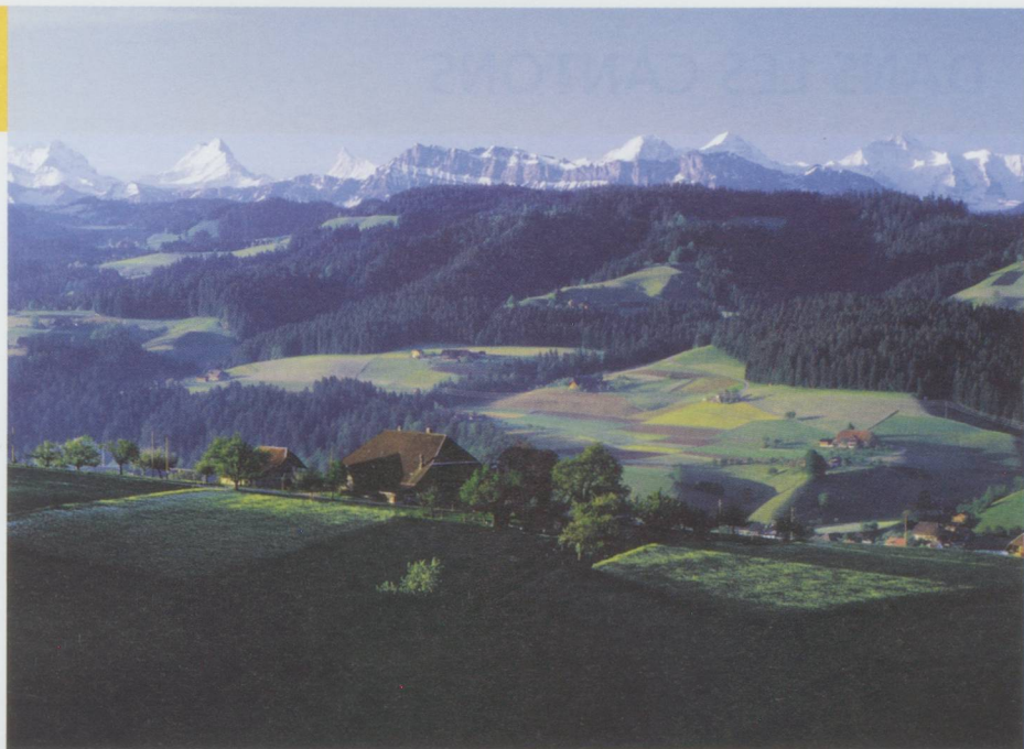
L'Emmental et les Alpes bernoises

■ L'amnistie fiscale jurassienne est un succès. En onze mois, 300 contribuables se