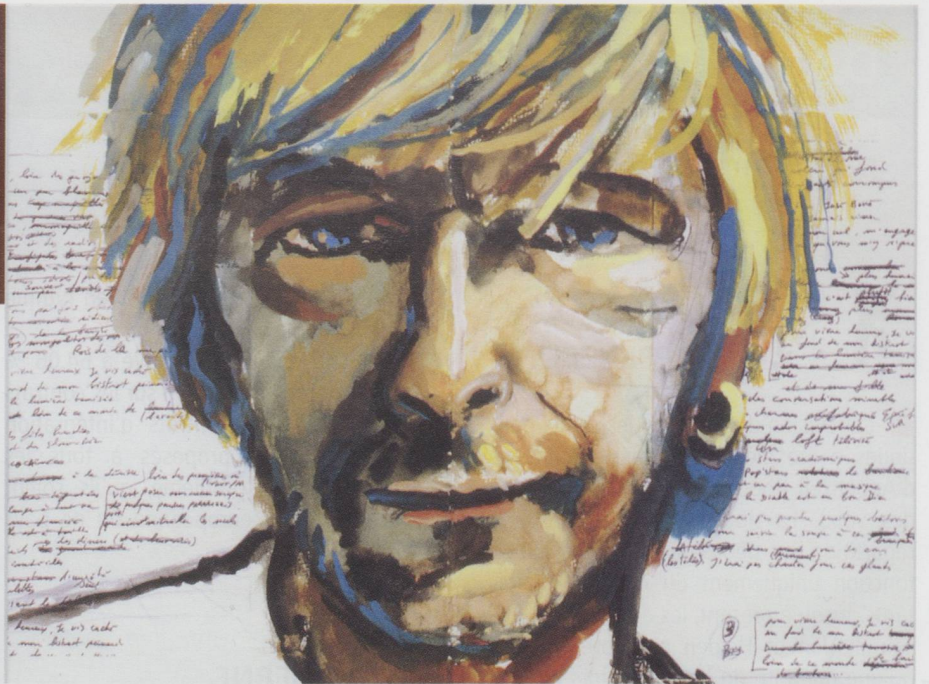
Renaud par Titouan, Chronique illustrée d'un enregistrement, illustrations de Titouan Lamazou, Gallimard Loisirs.

Renaud se trouve être aussi le petit-neveu de Louisa Siefert, poétesse française, née à Lyon en 1845 et morte à Pau en 1877. Arthur Rimbaud avec qui elle a entretenu une correspondance amicale, a dit de ses poèmes : « ... c'est aussi beau que les plaintes d'An-