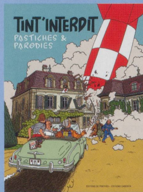
Tint'Interdit Alain-Jacques Tornare

Prix : 22 € - 160 pp. - ISBN 978-2-88295-717-7