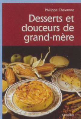
Desserts et douceurs de grand-mère Philippe Chavanne

Au travers de plus de 70 recettes, cet ouvrage nous remet en mémoire les plus fabuleuses préparations de desserts et de petites douceurs confectionnées jadis par nos grands-mères. Des recettes faciles à préparer et confectionnées avec les meilleurs produits.