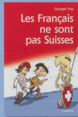
Les Français ne sont pas Suisses Georges Pop

Prix : 18 € - 48 pp. - ISBN 978-2-88295-697-2