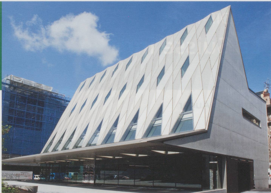
Le musée d'ethnographie de Genève dans son nouvel écrin.

À Jenins dans le canton des Grisons, le Greisinger Museum a ouvert ses portes en 2013 pour le plus grand plaisir des passionnés de Tolkien. Le fondateur, Bernd Greisinger, un gestionnaire de fonds allemand fortuné y a installé sa collection d'une grande ampleur : livres, œuvres d'art, objets en lien avec l'univers du romancier anglais. Le musée est une fondation à but non lucratif ; son entrée s'enfonce sous terre à la façon d'une maison de Hobbit et permet d'accéder aux différentes salles où le visi-