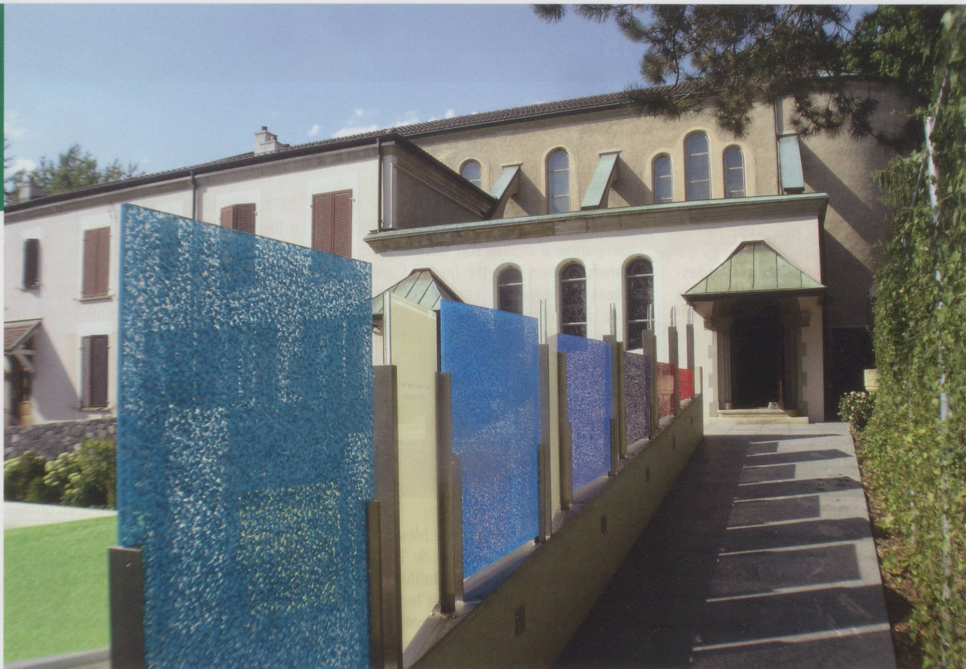
La paroisse du Sacré-Cœur à Lausanne : sur chaque stèle est gravée une citation de M. Zundel.

sion 5 . » Revenant à nouveau en France, Zundel organise des retraites et est aumônier à Neuilly.