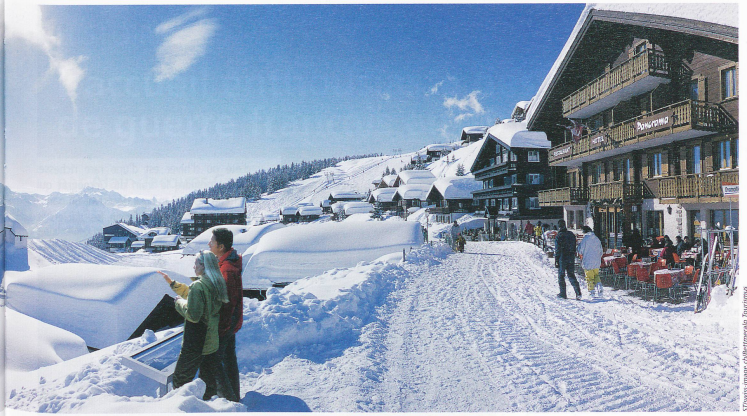
Bettmeralp (1950 m), station sans voiture surplombant la vallée du Rhône en Valais. En arrière-plan la chapelle Ste-Marie-de-la-Neige.

l'année, c'est un ancien hameau fondé par les Walsers, devenu village de montagne plein de charme et de tranquillité, posé sur un plateau surplombant la vallée de Lauterbrunnen. Celle-ci est célèbre par ses nombreuses cascades et les tonitruantes chutes souterraines de Trummelbach. Elle offre une vue unique sur le sublime trio des Alpes bernoises.