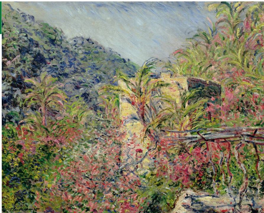
Claude Monet, Vallée de Sasso, effet de soleil, 1884, Huile sur toile, 65 x 81 cm – Paris, Musée Marmottan Monet – Exposition « Hodler, Monet, Munch. Peindre l'impossible », Paris.

Kunstmuseum, Museumstrasse 32, CH-9000 Saint-Gall. Jusqu'au 23 octobre 2016, du mardi au dimanche de 10 h à 17 h, mercredi jusqu'à 20 h.