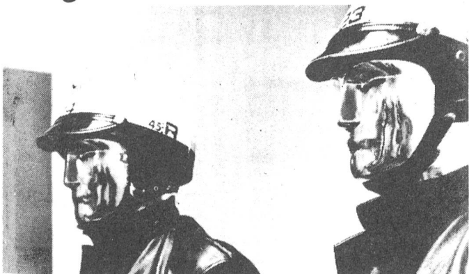
'Die Zeiten des 'Du'-Sagens sind vorbei...'