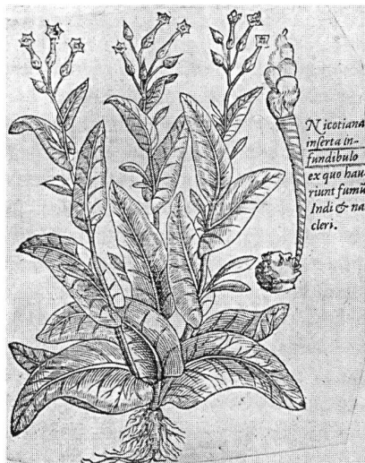
Erste Abbildung einer Tabakpflanze mit dem Vorgang des Rauchens.

«Ich verstehe es nicht !», sagte Hans Castorp. «Ich verstehe es nicht, wie jemand nicht rauchen kann, – er bringt sich doch , sozusagen, um des Lebens bestes Teil und jedenfalls um ein ganz eminentes Vergnügen. Wenn ich aufwache, so freue ich mich, dass ich tagüber werde rauchen dürfen, und wenn ich esse, so freue ich mich wieder darauf, ja ich kann sagen, dass ich eigentlich bloss esse, um rauchen zu können, wenn ich damit auch etwas übertreibe. Aber ein Tag ohne Tabak, das wäre für mich der Gipfel der Schalheit, ein vollständig öder und reizloser Tag, und