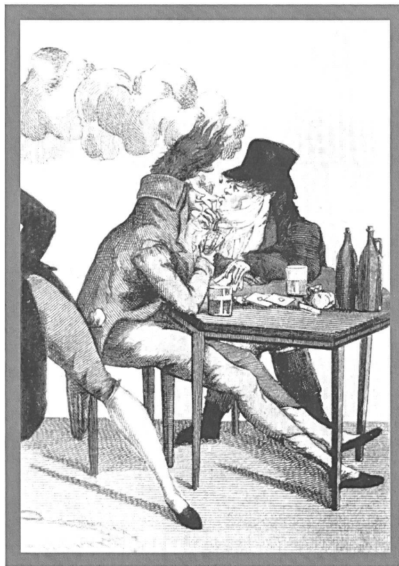
Eine der ältesten Darstellungen des Zigarettenrauchens