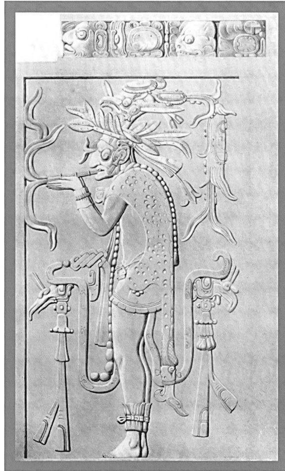
Rauchender Mayapriester, Relief am Tempel von Palenque.

Ich ignoriere es so, wie ich weigere zur Kenntnis zu nehmen, dass Enthaltsamkeit in der Liebe gesünder sei. Ich fahre Auto, obwohl ich die Statistiken kenne, ich gehe nachts durch dunkle Parks, ich reite, ich gehe nie vor Mitternacht schlafen, ich achte nicht auf Bananenschalen, ich lebe als Preusse in Bayern – verstehen Sie, ich will mit all dem sagen: Ich weiss um die Gefahren des