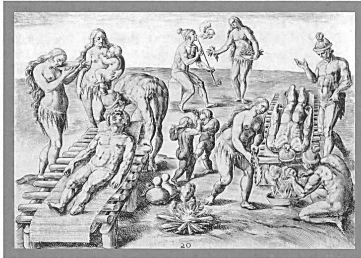
Abbildung der menschlichen Nichtigkeit vorstellt / und zu andern guten Gedanken Gelegenheit bildet...» (J.G.H. 1719, 22-31). Über die wohltuenden Gemütswirkungen des Rauchens – heute sprechen die Wissenschaften genauer von den positiven Wirkungen des Nikotins – wird unablässig debattiert.

Der anonym Tobackologe J.G.H. wusste bereits 1719 von den grossen Opfern zu berichten, den die RaucherInnen in aller Welt ihrer Begierde zu bringen bereit waren und sind. Lieber des Hungertodes sterben als Nichtrauchen, gleich die Scham mitabgeben, wenn die Lust des Rauchens aufkeimt, und bis zum letzten Atemzug paffen. Gerne-RaucherInnen geben eben alles für ihr Plaisir.