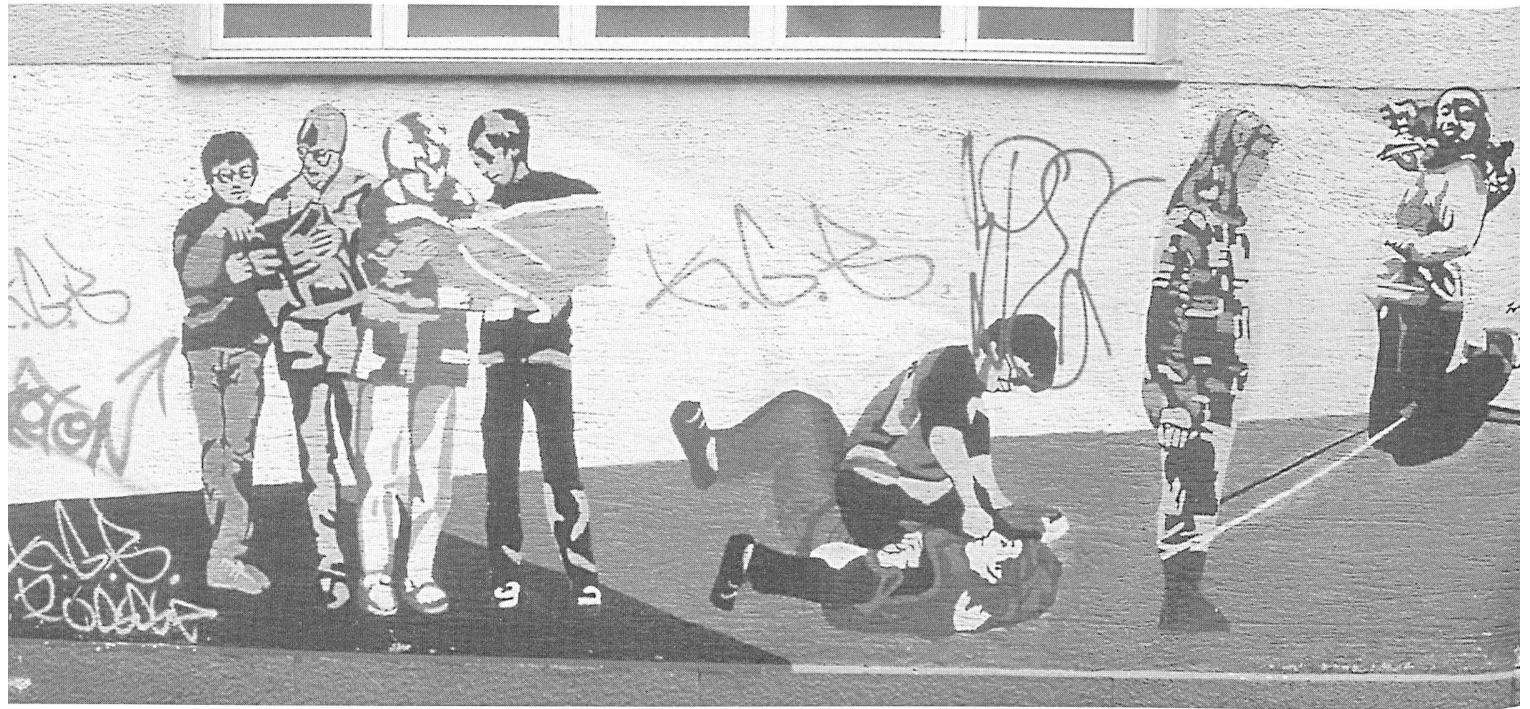
Wandmalerei am Gottfried Keller-Schulhaus in Basel.

Schulung der Persönlichkeit der Kinder und Jugendlichen? Genau hier liegt ein wichtiger Argumentationspunkt für ein Engagement der Präventionsarbeit in der Schule. Die Kinder sollen ja nicht nur Lesen, Schreiben und Rechnen lernen; sie sollen sich auch soziale Kompetenzen aneignen. Welche Kompetenzen das sind, ist nicht fest vorgegeben. Die Schule kann die Kinder und Jugendlichen darin unterweisen, sich einer Gruppe unterzuordnen, Befehlen zu gehorchen, fleissig und strebsam zu sein oder zu lernen, sich im harten Leistungswettbewerb gegen die MitkonkurrentInnen durchzusetzen. Sie kann aber auch der Ort sein, wo die Kreativität geschult, Teamfähigkeit gelernt, Streitkultur entwickelt, die Problemlösungsfähigkeit verbessert und die Kompetenz vermittelt wird, das Lernen zu lernen, sich also aus dem sich explosionsartig vermehrenden Gesamtwissen die relevanten Inhalte auszuwählen.