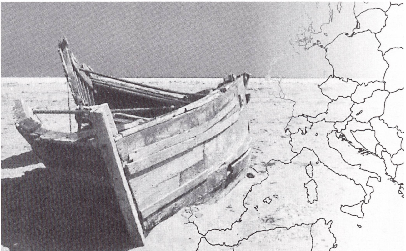
Aus: Beat Leuthardt, «An den Rändern Europas», 1999.

Zehntausende von Überfahrten von Menschen aus dem Norden Afrikas sowie aus afrikanischen Ländern südlich der Sahara. Währenddessen rüstet Spanien seine Kontrollen im Estrecho und an Land ständig auf, um diese Zehntausenden in ihren brüchigen Fischerbooten abzufangen. Es macht geltend, die Bootsfahrten dienten auch dem Import von marktgängigen illegalen Drogen. Dem halten Beobachter entgegen, dass kein Grosshändler das Risiko, seine Ware in der Meerenge untergehen zu lassen, in Kauf nimmt, abgesehen vielleicht von preisgünstigen Cannabisprodukten.