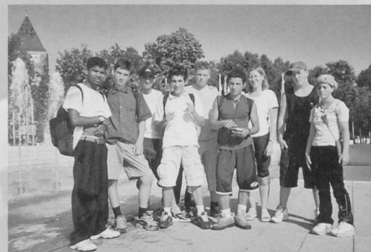
Klassenausflug am Ende des Schuljahres.

Ziel des Classe-atelier ist es, den SchülerInnen das nötige Rüstzeug zu vermitteln, damit sie eine Lehre antreten können oder zumindest einen Berufsweg finden. Während diesem letzten Schuljahr können sie so viele Schnupperlehren machen, wie sie möchten. Selbst wenn ein Junge oder Mädchen in der Schule nicht besonders gut ist, gibt es Arbeitgeber, die sie für eine Aufnahme in die Lehre akzeptieren, wenn sie während der Schnupperlehre zeigen, dass sie arbeitswillig und leistungsfähig sind. Sie können auch ein Lehrvorbereitungsjahr absolvieren oder Nachhilfeunterricht besuchen. «Falls sie mal ‹abstürzen›», meint der Projektleiter, «aber erkannt haben, wo ihre Schwierigkeiten liegen, können sie sich damit beschäftigen. Sie finden heraus, was dagegen zu tun ist, und wie das Hindernis überwunden werden kann. Wenn Sie ein Ziel erreichen wol-