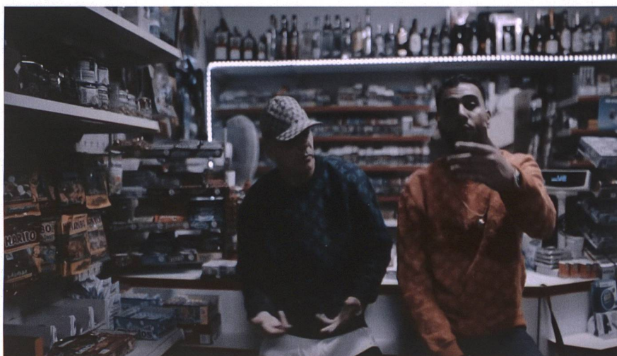
Abbildung 2: Ausschnitt aus dem Musikvideo «Tilidin» von Capital Bra & Samra. 2

Möglich ist auf Sozialen Medien natürlich auch eine kritische Auseinandersetzung mit dem Content. So wird vereinzelt in Online-Kommentaren Kritik am starken Alkoholkonsum in Dating-Shows laut, sei es wegen der damit verbundenen Glorifizierung von Alkohol oder der sichtbaren Enthemmung der Protagonist:innen. Starke Kritik erfuhr auch der Track «Tilidin», der laut Medi-