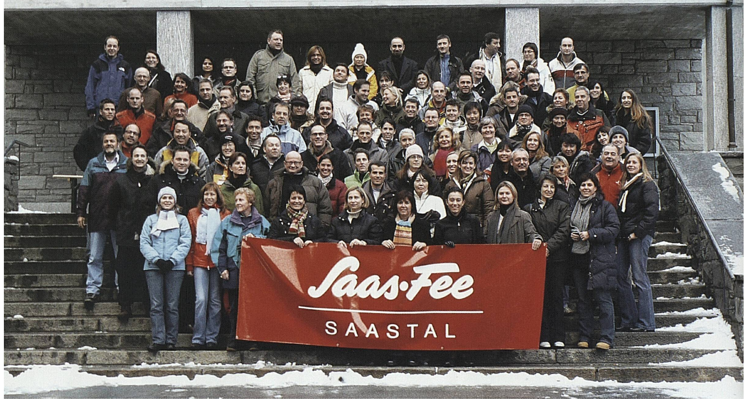
Die internationale ST-Crew trifft sich regelmässig für Workshops und strategische Seminare: dieses Mal in Saas-Fee. L'équipe internationale de ST se réunit régulièrement pour des ateliers et des séminaires stratégiques: cette fois-ci à Saas-Fee.