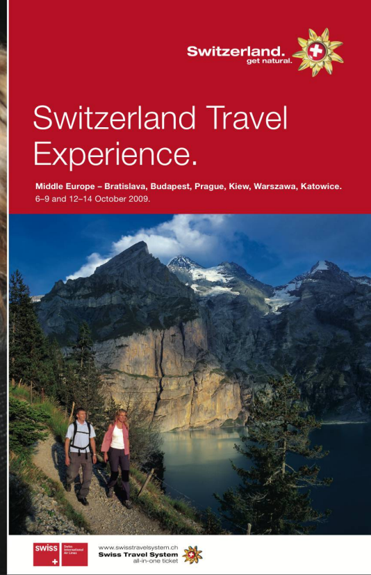
ST-Broschüre als Plattform für die Partner. La brochure ST, plateforme pour les partenaires.