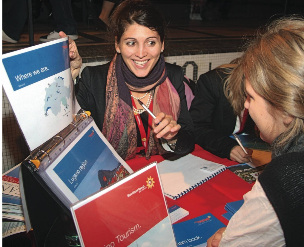
Mit Charme und guten Argumenten: Tessin Tourismus präsentierte die Vorzüge der Schweiz. Un bon argumentaire et une pointe de charme: Tessin Tourisme présente les atouts de la Suisse.