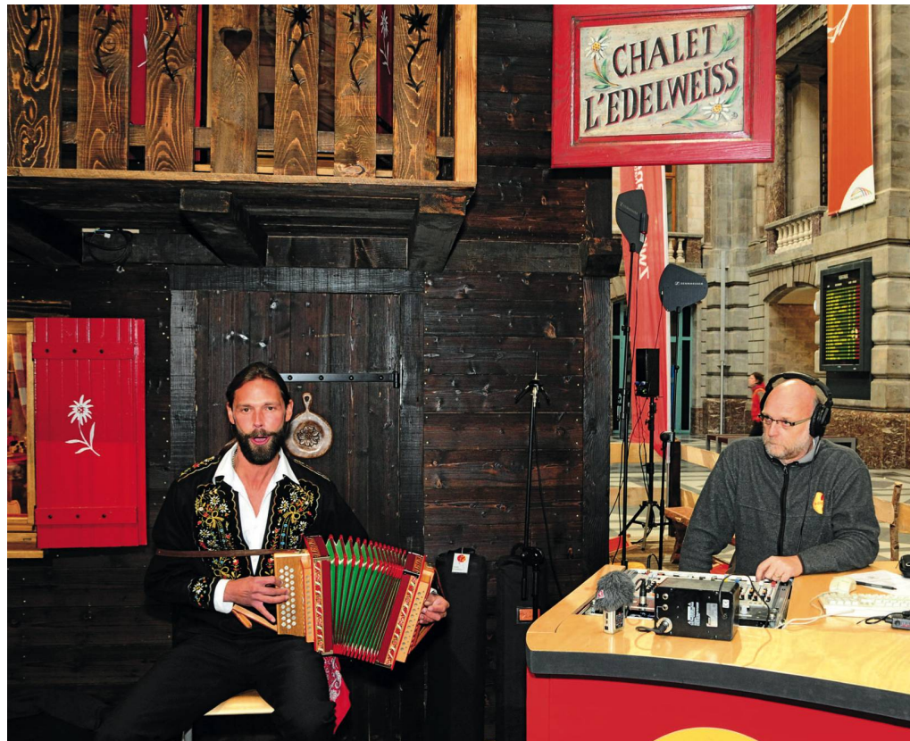
Fast 2,5 Millionen Belgier hörten mit: Live-Übertragung von Radio 2 aus dem Bahnhof Antwerpen. Emission en direct de la gare d'Anvers sur Radio 2: près de 2,5 millions d'auditeurs en Belgique.