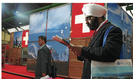
Am STM dabei: Einkäufer aus 45 Ländern. Le STM a attiré des acheteurs de 45 pays.

Organisé tous les deux ans par ST, le STM est le principal événement de promotion des ventes du tourisme suisse. C'est aussi une excellente plateforme de présentation pour la Suisse, destination de voyage, de vacances et de congrès. Les participants ont également l'occasion de visiter la Suisse avant et après le salon.