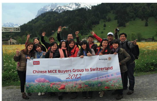
Die Teilnehmenden der Studienreise aus China bei ihrem Ausflug auf den Titlis.

Die ST-Abteilung SCIB baute die Marktpräsenz 2012 in den Städten Peking, Schanghai, Hongkong und Guangzhou aus. Dazu gehörten unter anderem Schulungen mit Incentive-Agenturen und anderen wichtigen Entscheidungsträgern. SCIB koordinierte hierzu eine Studienreise für zwölf Organisatoren von Incentive-Reisen nach Zürich, Luzern und auf den Titlis, aus der bereits erste Folgegeschäfte entstanden.