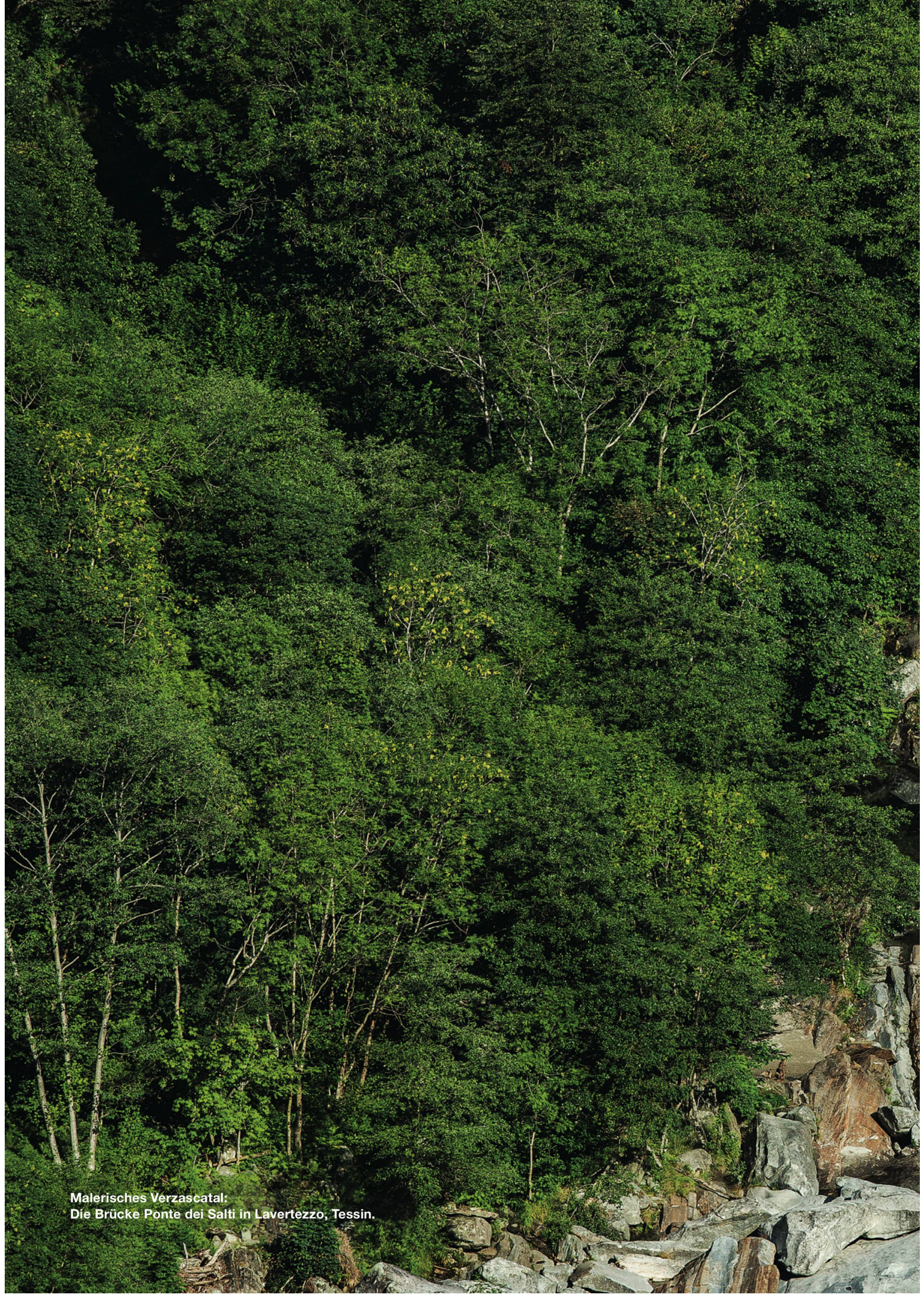
Malerisches Verzascatal: Die Brücke Ponte dei Salti in Lavertezzo, Tessin.