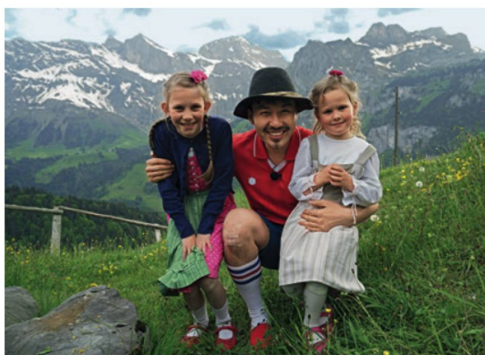
Heidi-Feeling: Entertainer Noh Hong-chul in Engelberg.