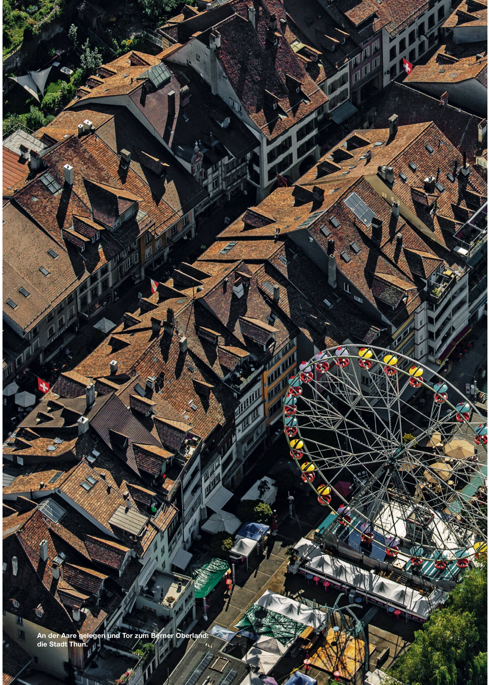
An der Aare gelegen und Tor zum Berner Oberland: die Stadt Thun.