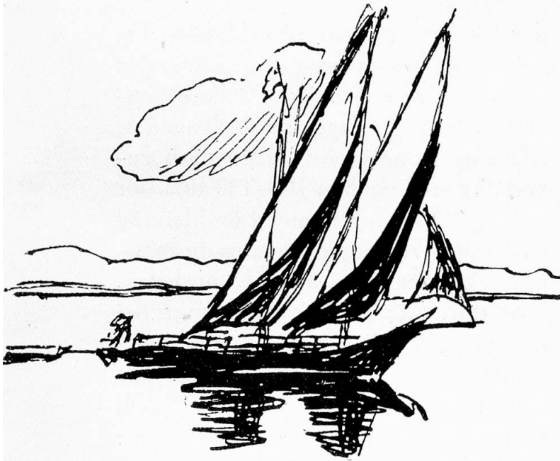
Barques du Léman