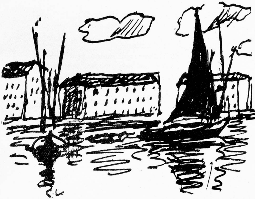
Au port de Genève