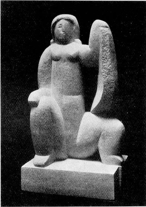
Laurens, Paris Sitzende Frau, Stein Femme assise, pierre