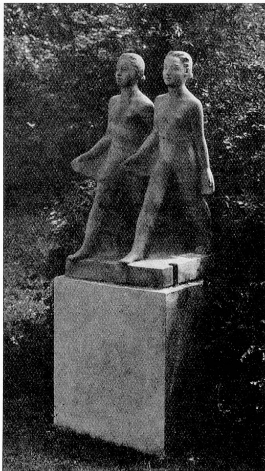
J. Probst, Basel Schreitende Mädchen Terrakotta