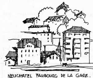
NEUCHÂTEL FAUBOURG DE LA GARE.

Frappée par l'industrie, elle est achevée par le commerce et la spéculation. Le capital commande. Il faut « renter ». On mesure la distance qui sépare la Sainte Chapelle d'une maison locative.