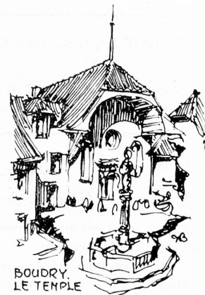
BOUDRY. LE TEMPLE

Il est indispensable que l'architecte se hausse à la dignité de son art et se rende capable de donner un conseil à l'artiste qui parachève