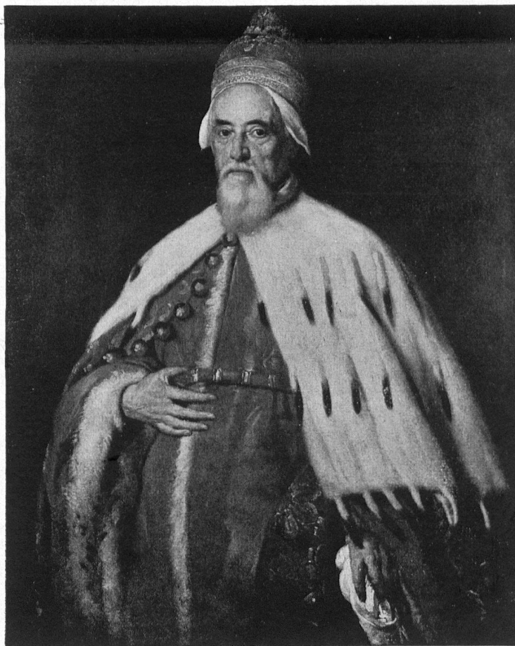
Bernardo Strozzi, Doge Francesco Erizzo (Wien, Kunsthistorisches Museum)