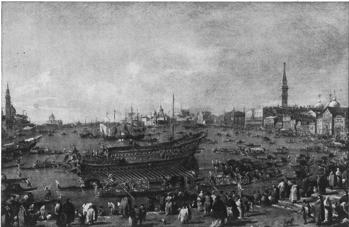
Guardi, Bucentaur (Paris, Louvre)

Das große Jahrhundert der venezianischen Malerei ist das sechzehnte, in dessen ersten Jahrzehnten der greise Giovanni Bellini, der junge Giorgione und der junge Tizian nebeneinander arbeiten, in dessen letzten Jahrzehnten noch Tintoretto und Paolo Veronese gestalten. Giovanni Bellini und Giorgione wirken auf Tizian, wie dann von diesem Tintoretto und Paolo Veronese ausgehen. Durch dieses ganze Jahrhundert hindurch vollzieht sich ein herrliches und ständiges Nehmen und Geben. Alle großen oder bedeutenden Maler des sechzehnten Jahrhunderts, außer Tintoretto und Paolo Veronese sind im letzten Viertel des fünfzehnten Jahrhunderts geboren; sie bilden gleichsam auch eine mächtige «Generation um 1480»; um 1500 stehen sie in ihrer Jugend und entfalten sich nun in einem wunderbaren Wettstreit, miteinander und gegeneinander, indem sie sogar dort noch aneinander lernen, wo sie gegensätzlich sind.